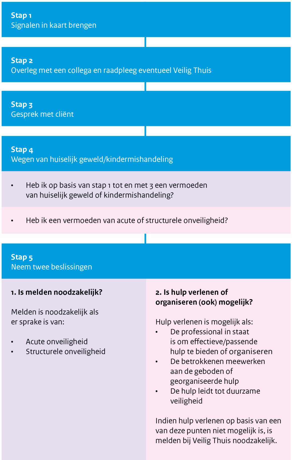
Figuur 1: Stappenplan verbeterde meldcode